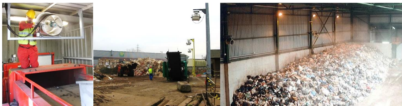
Behandeling van grote binnen- en buitenvolumes